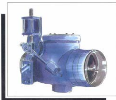
稳定缸，控制杆和平衡装置