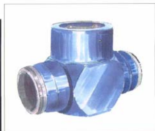
带对接焊端的标准型